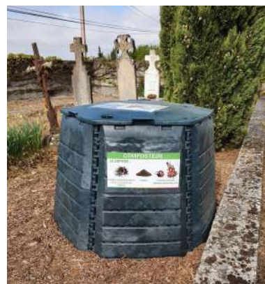
Cimetière de Saint Menne