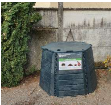
Cimetière du village

Un composteur de 830 litres a été installé à l'entrée de chacun des 2 cimetières de la commune (au village et à Saint Menne).